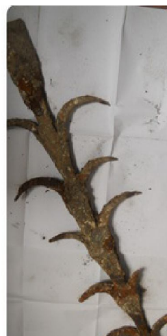
Фрагмент кованого ограждения.