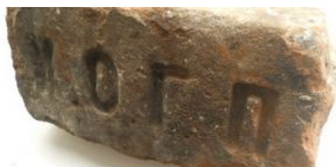
Еще одна находка исследователей.