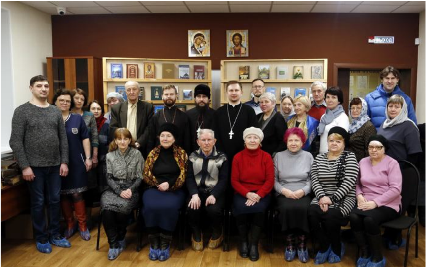
Участники Дня православной книги в конференц-зале Духовно-просветительского центра Вознесенского кафедрального собора Кузнецка