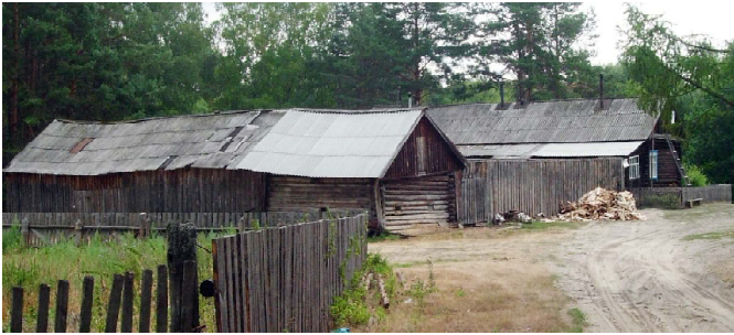
Липовка - кордон